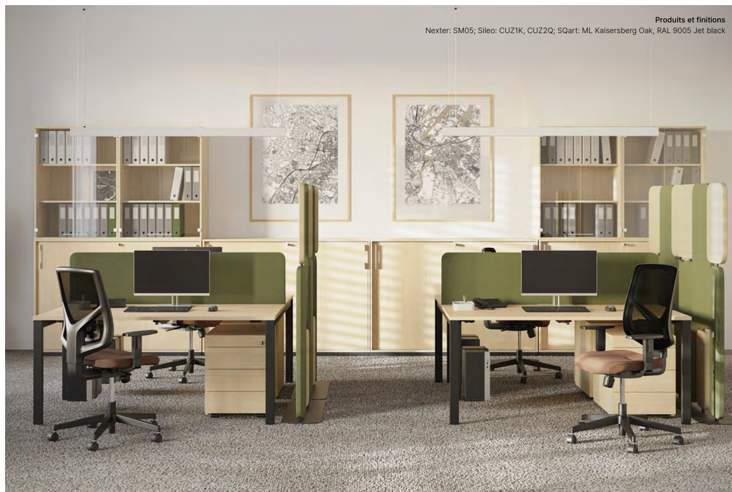
Produits et finitions Nexter: SM05; Sileo: CUZ1K, CUZ2Q; SQuart: ML Kaisersberg Oak, RAL 9005 Jet black